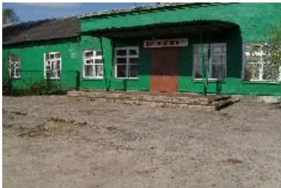
Школа № 5 – 1944 г.