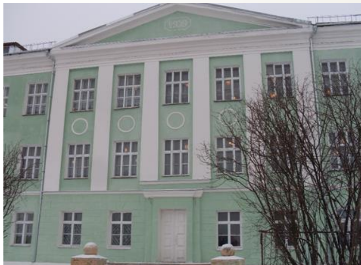
Школа № 6 – 1931 г.