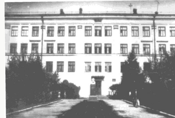
Школа № 3. Вид на вход с памятником К.Марксу (установлен в 1967 г.)