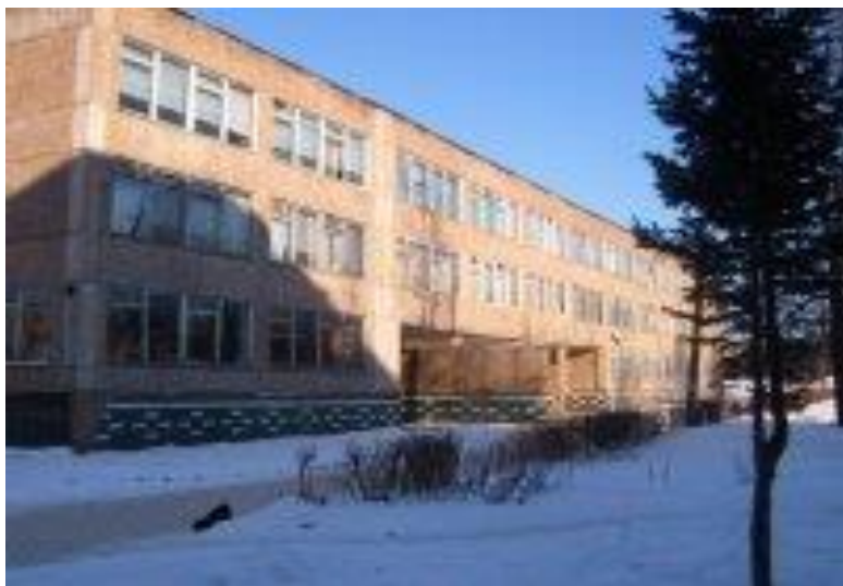
Школа №1 – 1929 г.